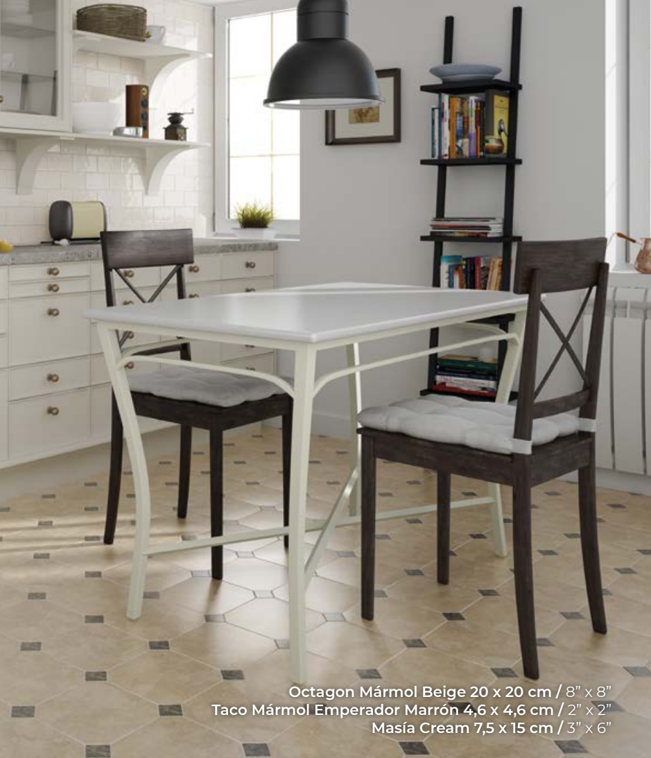
Octagon Mármol Beige 20 x 20 cm / 8" x 8" Taco Mármol Emperador Marrón 4,6 x 4,6 cm / 2" x 2" Masía Cream 7,5 x 15 cm / 3" x 6"