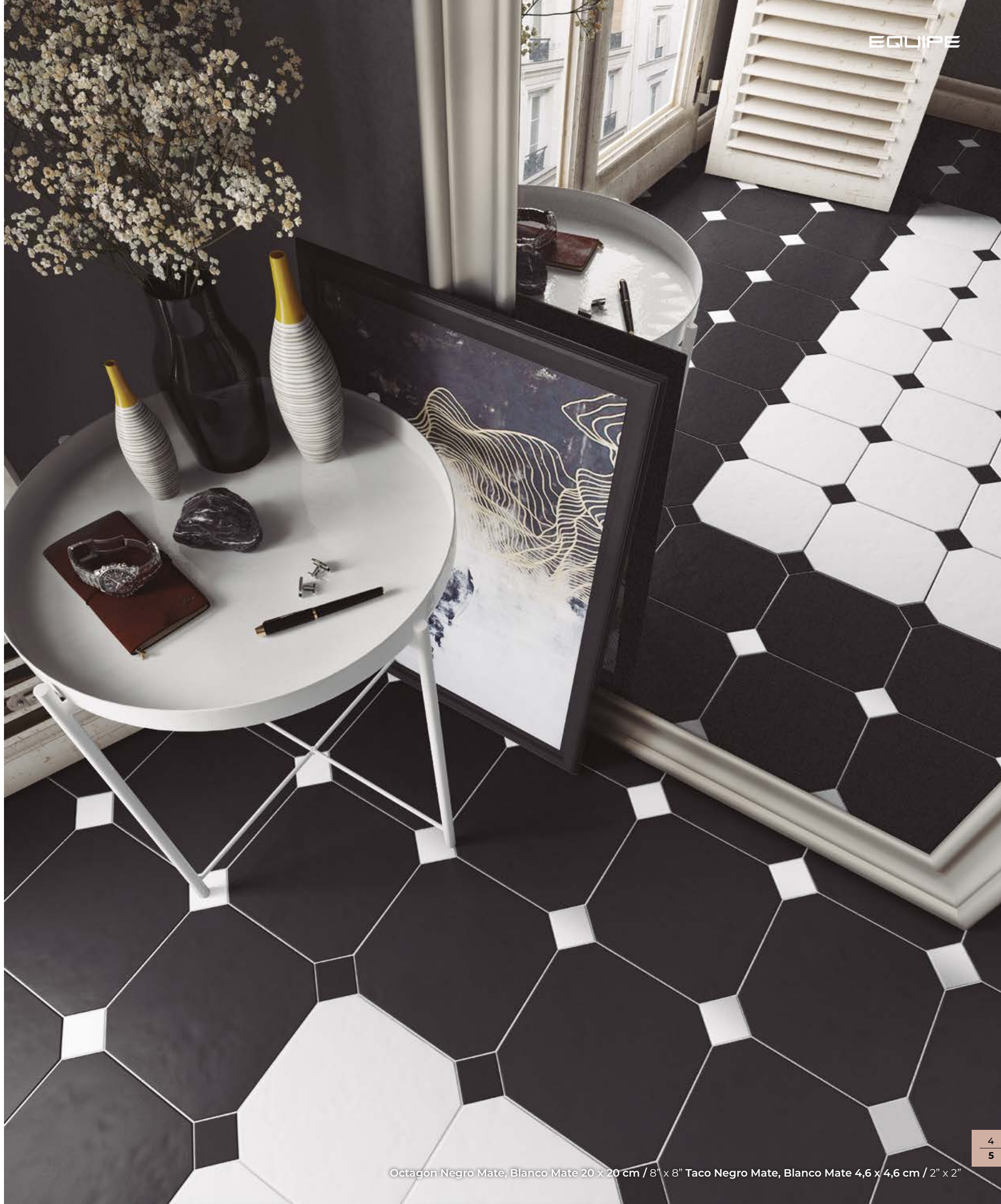
Octagon Negro Mate, Blanco Mate 20 x 20 cm / 8" x 8" Taco Negro Mate, Blanco Mate 4,6 x 4,6 cm / 2" x 2"