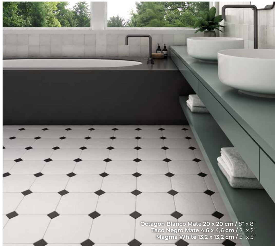
Octagon Blanco Mate 20 x 20 cm / 8" x 8" Taco Negro Mate 4,6 x 4,6 cm / 2" x 2" Magma White 13,2 x 13,2 cm / 5" x 5"